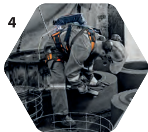
4 Postures prolongées

Les travailleurs sont « assistés » dans leurs mouvements et dans l'exécution de certaines tâches. Le port d'exosquelette permet d'alléger l'effort musculaire, de réduire la fatigue, de prévenir les blessures et les TMS, et d'apporter un réel support au travailleur.