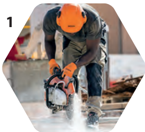
1 Poids Force musculaire