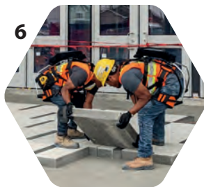
6 Déplacement d'objets lourds