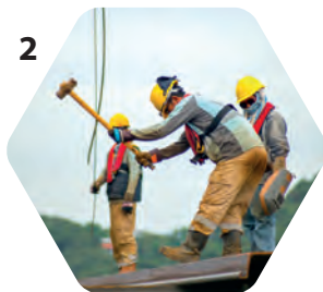
2 Durée/Fréquence Temps de concentration