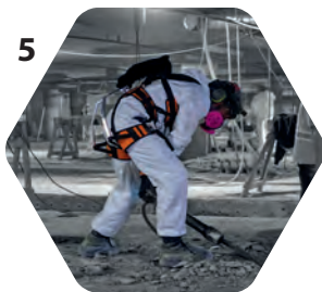
5 Maintien d'outils