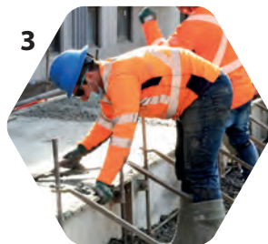
3 Posture Angle du dos