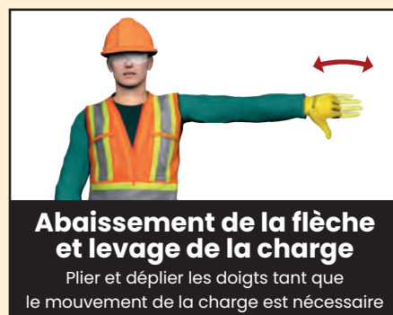
Abaissement de la flèche et levage de la charge Plier et déplier les doigts tant que le mouvement de la charge est nécessaire