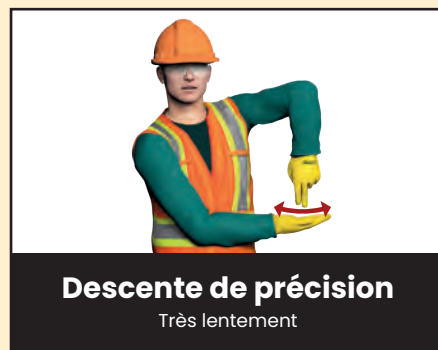
Descente de précision Très lentement