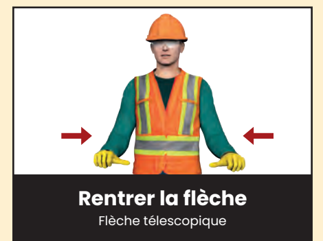
Rentrer la flèche Flèche télescopique