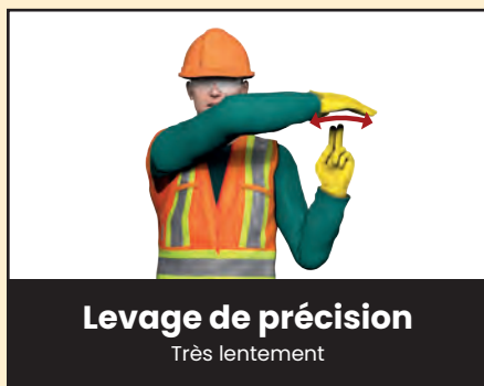
Levage de précision Très lentement