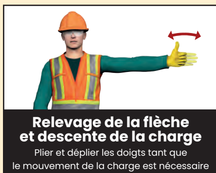
Relevage de la flèche et descente de la charge Plier et déplier les doigts tant que le mouvement de la charge est nécessaire