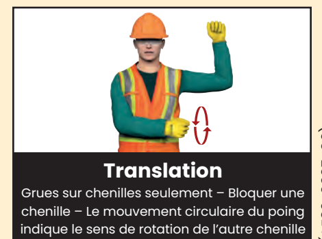
Translation Grues sur chenilles seulement – Bloquer une chenille – Le mouvement circulaire du poing indique le sens de rotation de l'autre chenille