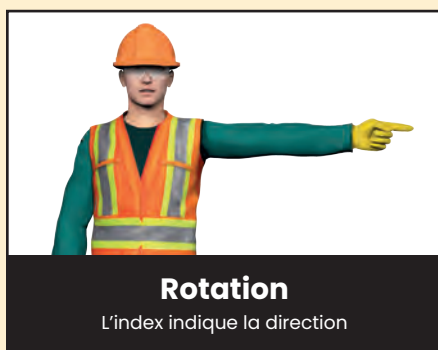
Rotation L'index indique la direction