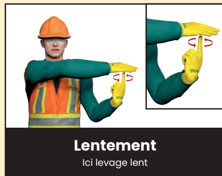
Lentement Ici levage lent