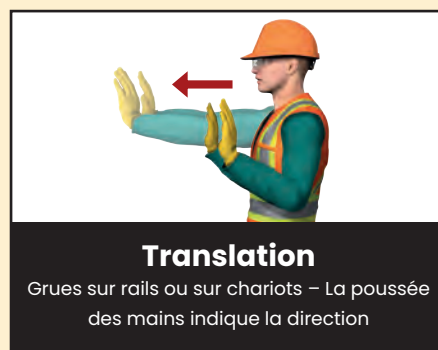
Translation Grues sur rails ou sur chariots – La poussée des mains indique la direction