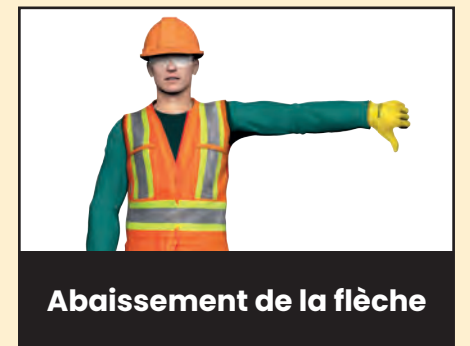
Abaissement de la flèche