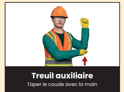
Treuil auxiliaire Taper le coude avec la main