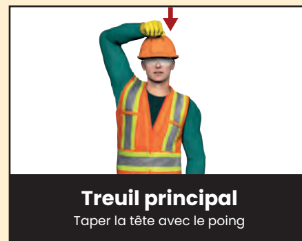
Treuil principal Taper la tête avec le poing