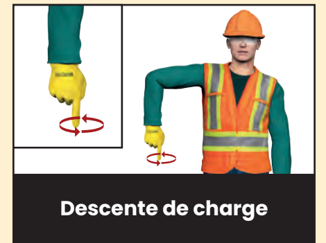
Descente de charge