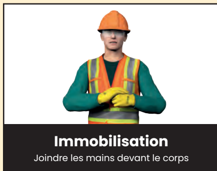
Immobilisation Joindre les mains devant le corps