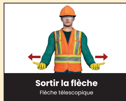
Sortir la flèche Flèche télescopique