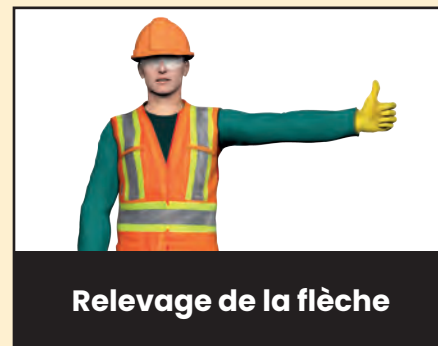
Relevage de la flèche